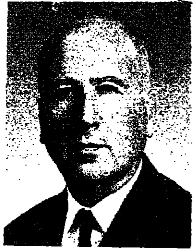
بقلم : الدكتور والتر ايتان

جديدة غير متوقعة في المنطقة ، وبسبب من مشاكل داخلية ، وبخاصة مشاكل سياسية ، في البلدين الرئيسيين - اسرائيل ومصر .